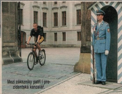
Mezi zákazníky patří i prezidentská kancelář.