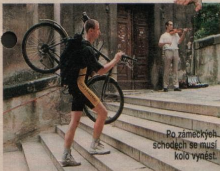
Po zámeckých schodech se musí kolo vynést.