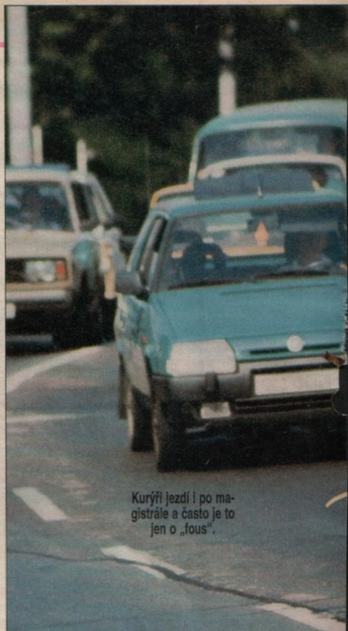
Kurýři jezdí i po magistrále a často je to jen o „fous“.